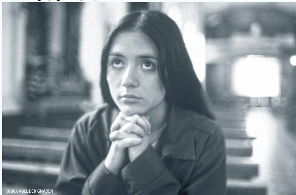
MARIA VOLL DER GNADEN