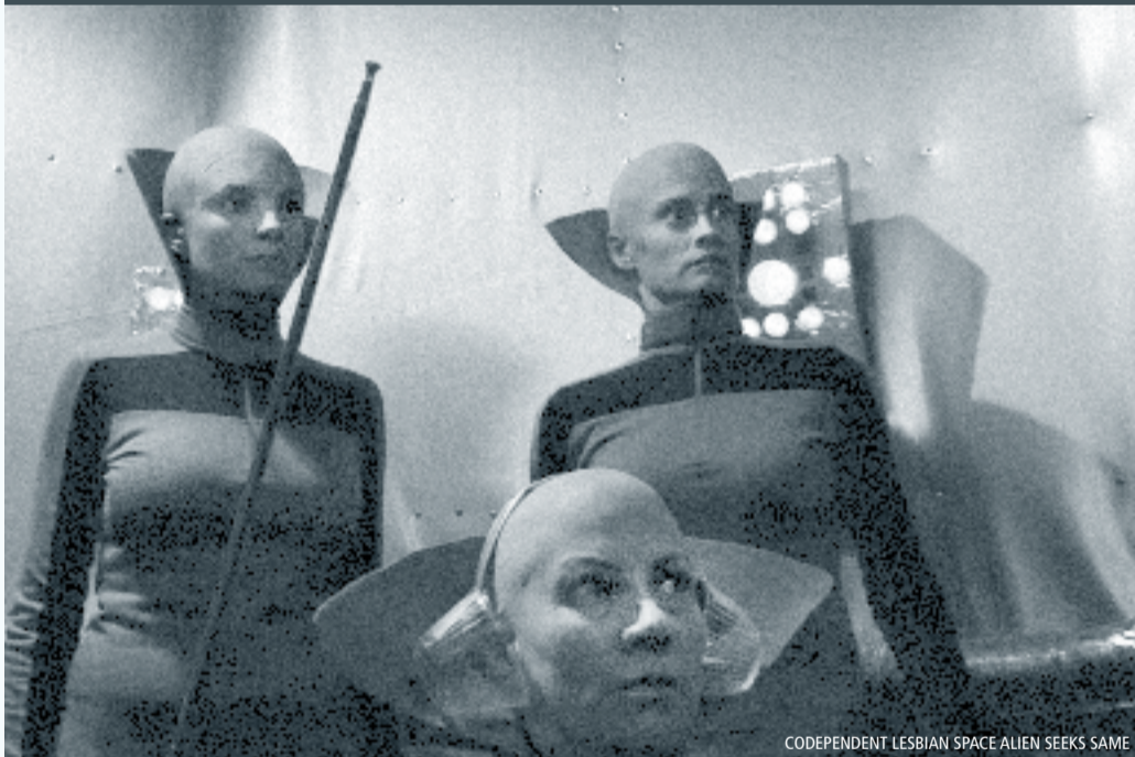
CODEPENDENT LESBIAN SPACE ALIEN SEEKS SAME