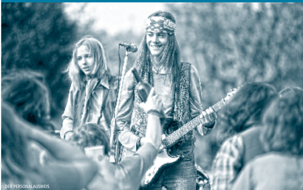
DER PERSONAL AUSWEIS