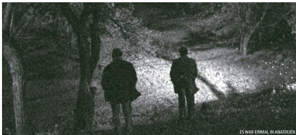
ES WAR EINMAL IN ANATOLIEN

Aufnahmeprüfung und trifft immer öfter falsche Entscheidungen. Währenddessen geht seine Mutter auf ein unmoralisches Angebot von Servet ein.