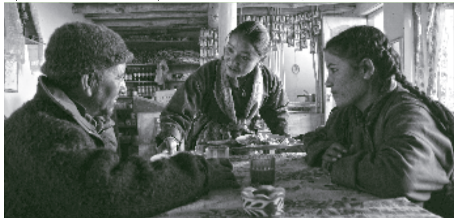
zweifelte Sehnsucht nach körperlicher Nähe nicht erfüllen. Do., 21.3. bis Mi., 10.4.