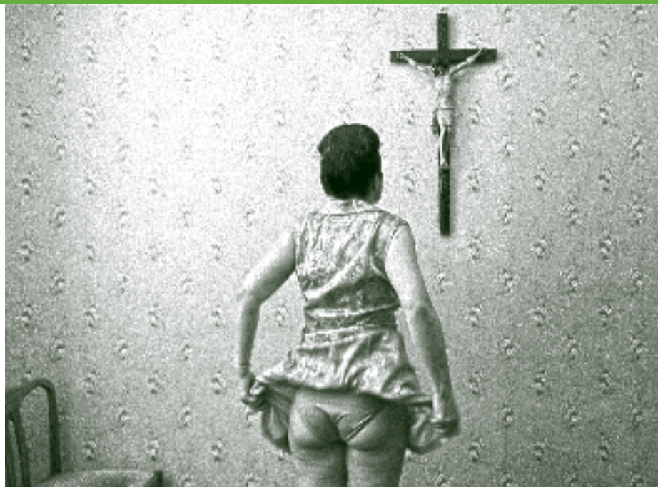
heiten aus. Als die Gewalt eskaliert, wird ihr Glauben auf eine harte Probe gestellt. Denn Jesus kann Anna Marias ver-

Im zweiten Teil seiner Trilogie PARADIES: GLAUBE verknüpft Ulrich Seidl Sex, Gewalt und Religion und löste damit einen handfesten Skandal bei den Filmfestspielen in Venedig aus. Teresas Schwester Anna Maria ist mit Leib und Seele Katholik, sie empfindet die Welt, in der sie lebt, als gottlos. Sie rutscht auf Knien betend durch die Wohnung, ihr Haus hat mehr Kruzifixe als eine Kirche und zur Strafe für fremde Sünden peitscht sie sich gern mal aus. Selbst mit ins Bett nimmt Anna Maria ihren Jesus. Ihren Urlaub verbringt sie damit, eine Wandermuttergottes-Statue von Haus zu Haus zu bringen, um Einwanderer und Sesshafte vom christlichen Paradies zu überzeugen und Österreich wieder katholisch zu machen. Eines Tages kehrt ihr Ehemann Nabil, ein im Rollstuhl sitzender Moslem, nach Jahren der Abwesenheit aus Ägypten zurück und fordert seine Rechte als Ehemann ein. Ein Kleinkrieg um Ehe und Religion beginnt. Während Nabil Kruzifixe und Papst-Ikonen von den Wänden pflückt, besprüht Anna Maria ihren Mann mit Weihwasser. Im Auftrag höherer Autoritäten tauschen Anna Maria und Nabil statt körperlicher Liebe bald seelische und körperliche Gemein-