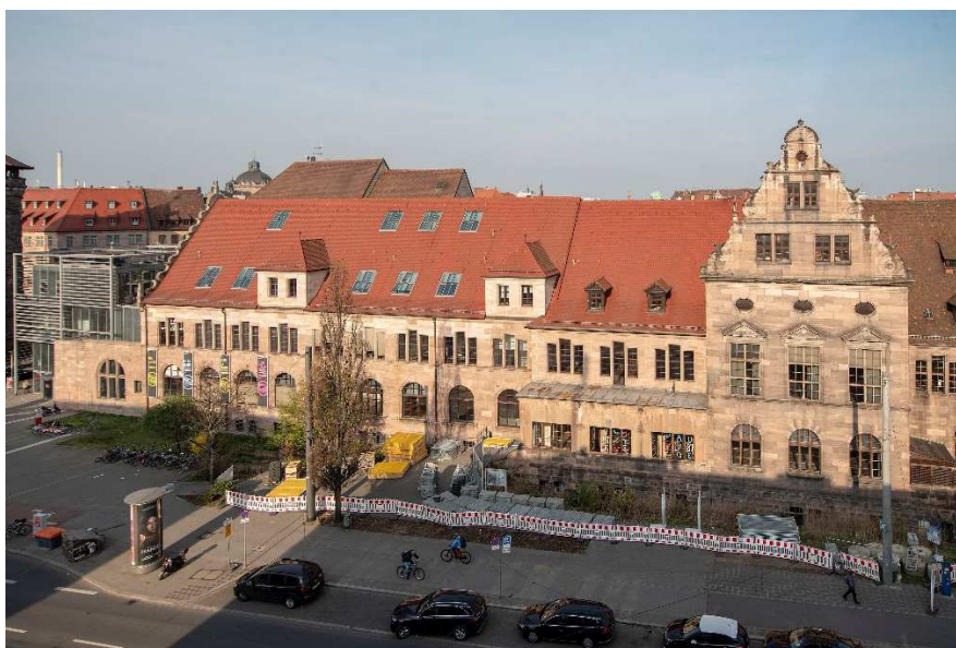
Ostfassade Künstlerhaus, Fotografie April 2019

Ansicht Ost, neuer Haupteingang, Entwurfsplanung Florian Nagler Architekten 2017