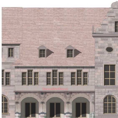
Ansicht vom Königstorgraben

Der KulturGarten wird mittels einer den Hof überquerenden Brücke barrierefrei mit dem Künstlerhaus verbunden. Auch von der Königstormauer aus ist der KulturGarten zukünftig über eine Rampe barrierefrei erschlossen. Bislang nicht vorhandene Herren- und Damentoiletten können neben dem Wehrturm und neben dem Ausschank eingerichtet werden.