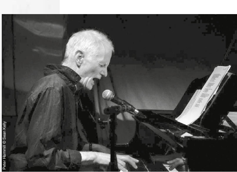
Peter Hammill

Peter Hammill ist ohne Zweifel einer der ganz großen Musiklegenden Englands und hat Generationen von Musikern maßgeblich beeinflusst. Seit Jahrzehnten gehört er, neben Größen wie King Crimson, Genesis und Pink Floyd, zu den wichtigsten Vertretern britischer Popkultur. Nun kommt Hammill mit seiner neuen Platte ›From The Trees‹ – und natürlich einigen Klassikern – für zwei Abende mit unterschiedlichem Programm ins Künstlerhaus!