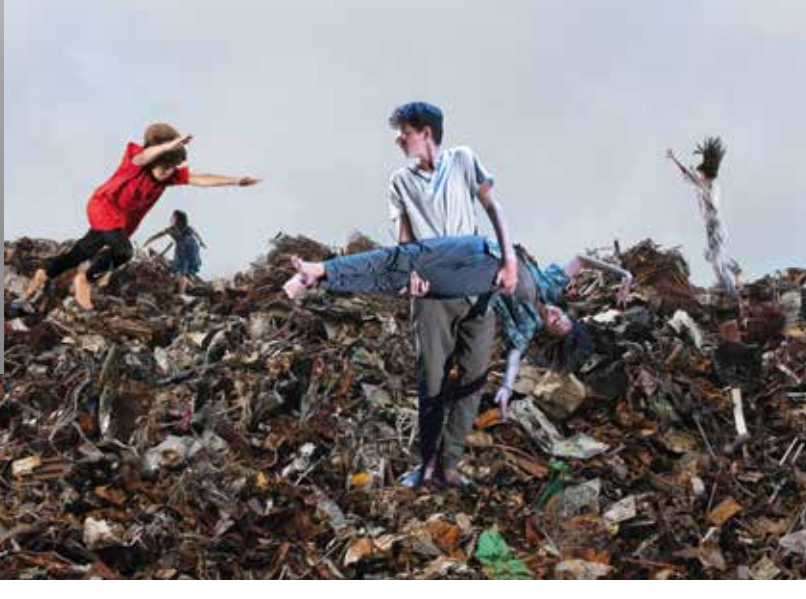
Tumult und Macht © Karen Stober