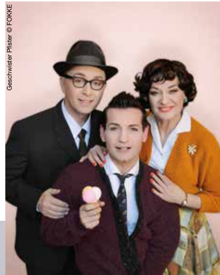
Geschwister Pfister