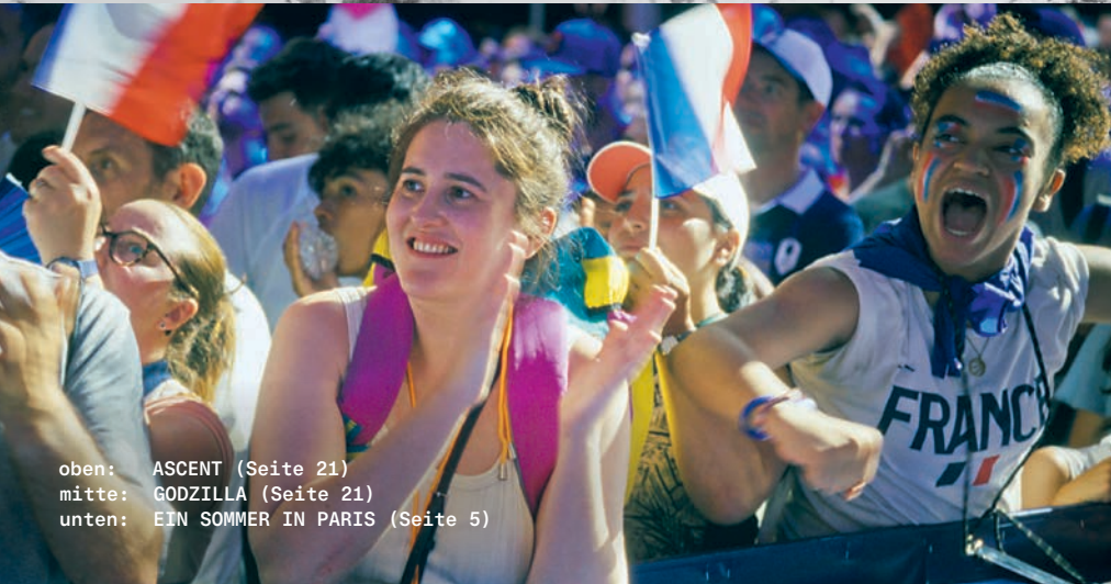
oben: ASCENT (Seite 21) mitte: GODZILLA (Seite 21) unten: EIN SOMMER IN PARIS (Seite 5)