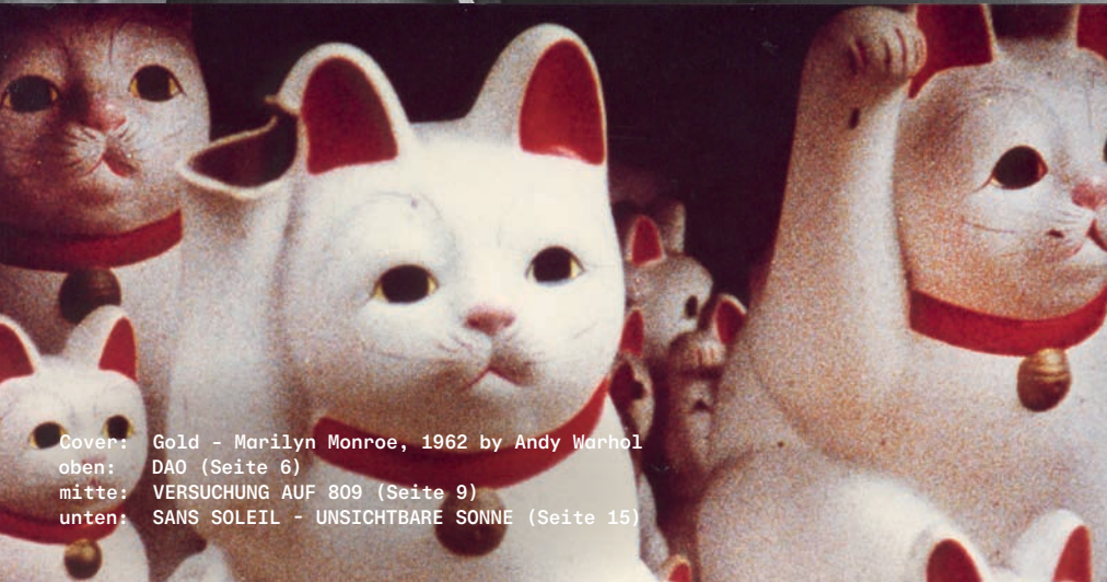
Cover: Gold - Marilyn Monroe, 1962 by Andy Warhol oben: DAO (Seite 6) mitte: VERSUCHUNG AUF 809 (Seite 9) unten: SANS SOLEIL - UNSICHTBARE SONNE (Seite 15)