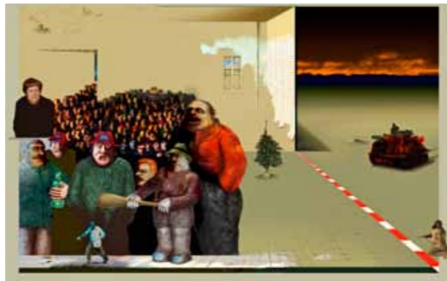
Rolf Fütterer, Das schaffen wir, 2016

Öffnungszeiten: Di – So, 10 – 18 Uhr, Mi, 10 – 20 Uhr, Mo geschlossen