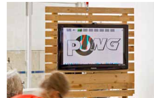
Drobny und Tuercke, PingPong, 2016