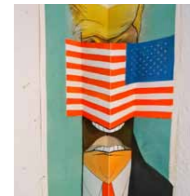
Peter Thiele, E1 America first, 2017

Gebühr pro Führung jeweils: 3 EUR zzgl. zum Eintrittspreis