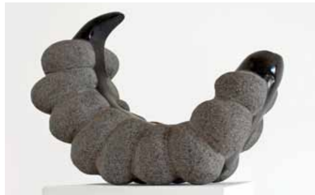
Michaela Biet, Das Innerste, 2016