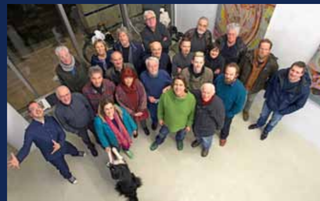
Die Mitglieder der Künstlergruppe 2017