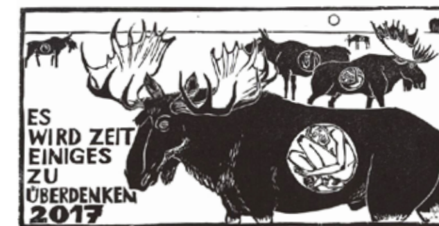
Christian Rösner, Es wird Zeit einiges zu überdenken, 2017